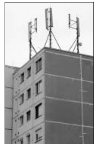
Antény na strechách budú minulosťou