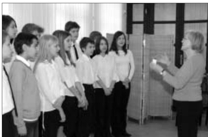
Súčasnou slávnostného odovzdania bol aj kultúrny program