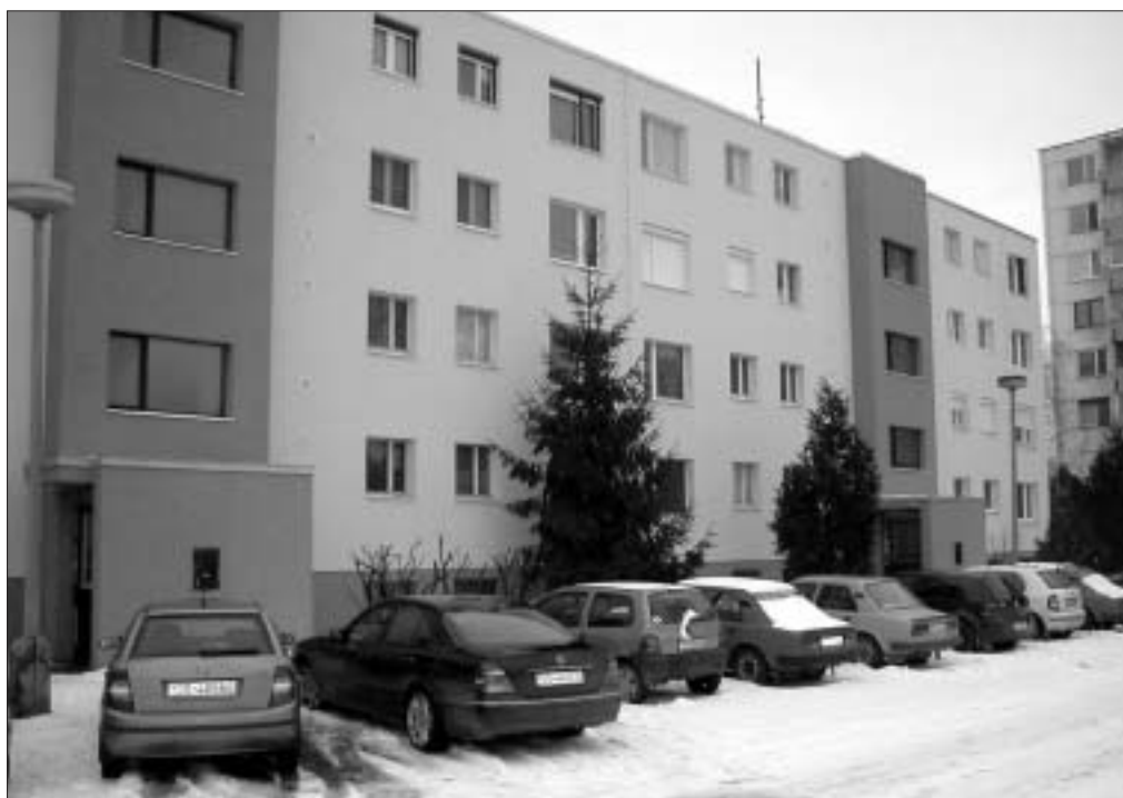
Hőszigetelt panelház a Jilemnický utcában. A fűtési költségek a felére csökkenhetnek.

– Az említett alapból tudomásom szerint hitel igényelhető 1%-os kamattal. Szerintem ez a pénz országos szinten kevés. Cégünkönél is van elérhető és gyors megoldás. Tudunk kedvező, hosszú lejáratú banki hitelt intézni, a kivitelezőt pedig az adott lakóközösség, tehát a tulajdonosok választják ki maguknak. Erre mostanában egyre több példa van, városunkban kezd gyarapodni az utólagosan hőszigetelt lakóházak száma. A lakásszövetkezetnél már 3-4 lakótömb (200 lakással) készült el, de példájukat mások is követik. Az érdeklődés bizonyára nőni fog, hiszen az emelkedő energiaárak mellett az utólagos külső lakás-hőszigetelés 1 négyzetméterre jutó fajlagos beruházási költségének visszatérülése felgyorsul.