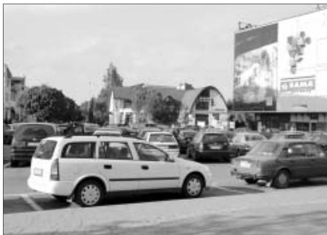
AKék Duna előtti térségen épül meg a föld alatti parkoló