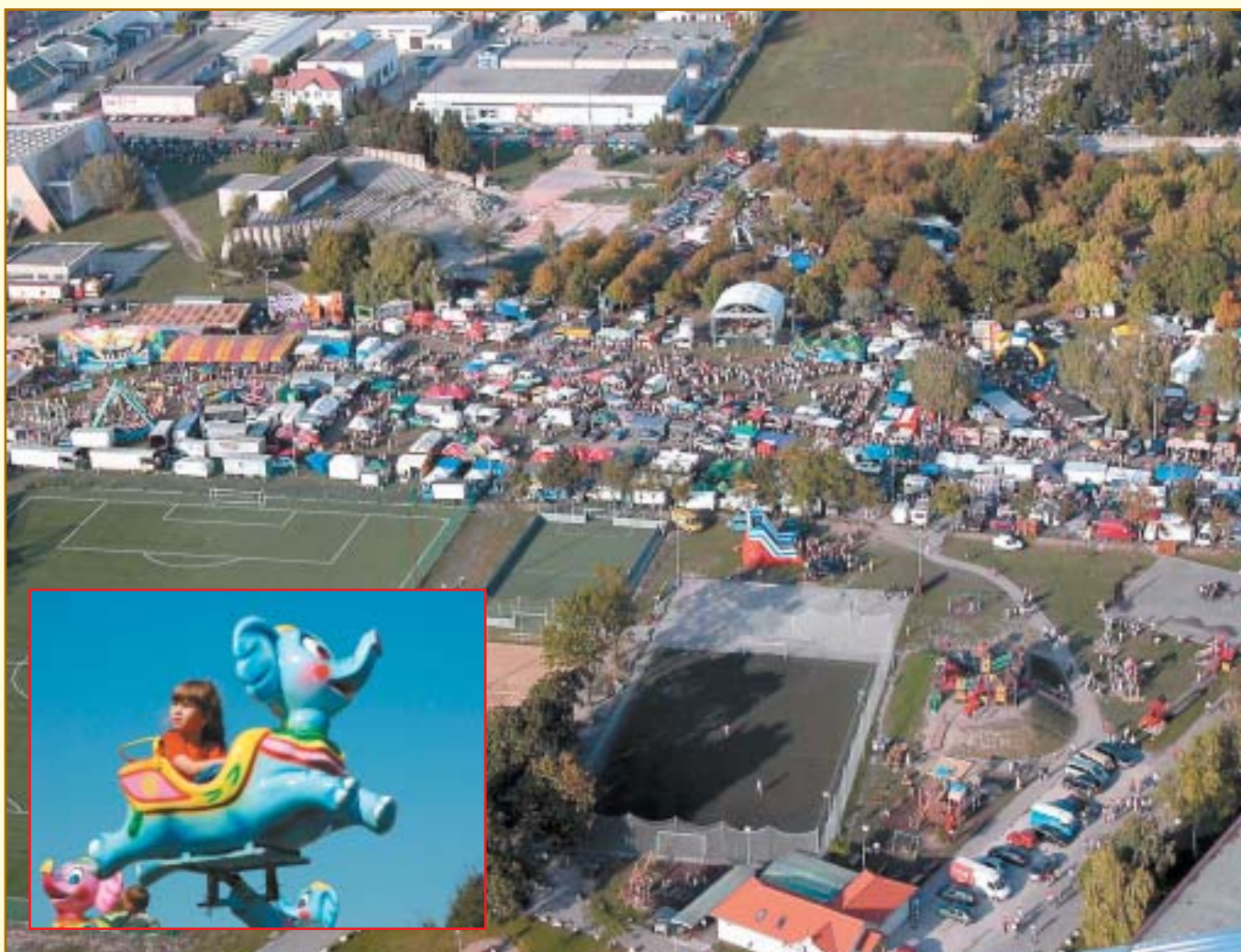
Ragyogó napsütés és remek hangulat jellemezte a XXVI. Csallóközi Vásárt Výborné počasie a vynikajúca nálada na 26. Žitnoostrovskom jarmoku