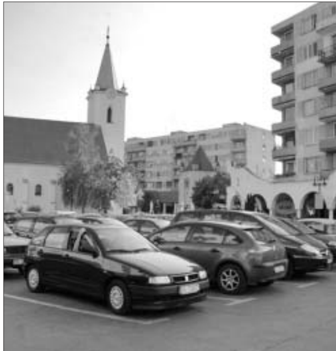
V tejto lokalite bude vybudované nové podzemné parkovisko

Nové názvy ulíc: V súlade s novým rozvojovým programom mesta vznikli v našom meste nové ulice. Nové ulice budú pomenované po nasledovných historických osobách: János Esterházy, Mihály Marczell, Kráľ Žigmund, Zsigmond Móricz, János Arany, Endre Ady a László Mécs. Cestu za Hypernovou pomenujú po Aradských mučeníkoch. (on)