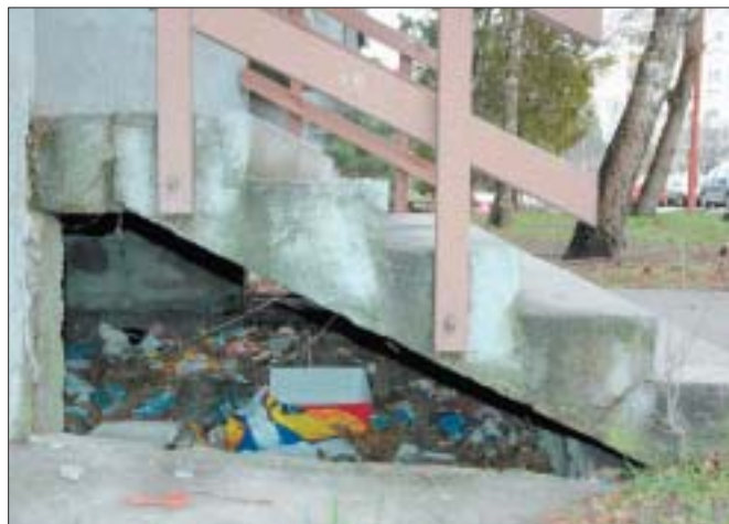
Szemet a lépcsők alatt is