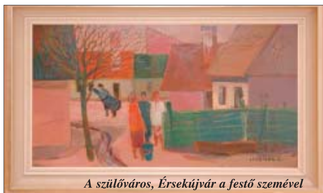
A szülőváros, Érsekújvár a festő szemével

Ha valaki, akkor Luzsicza Lajos megérdemelte, hogy önálló kiállítása legyen a Vermes villában. Hiszen mint Pázmány Péter polgármester a március másodikki tárlatnyitón mondott rövid beszédében