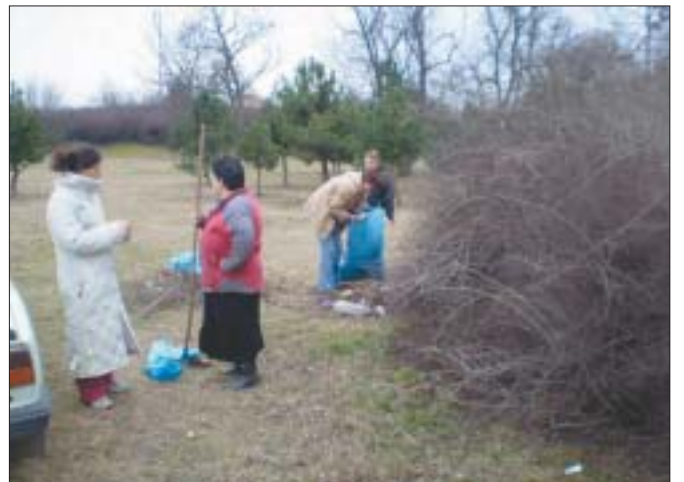
A közmunkát végzők naponta 200 – 250 kilogramm szemetet szednek össze