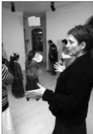
A kiállítás megnyitóján a tárlatvezetésre maga a művésznő vállalkozott.

● Korábban már lapunk hasábjain is beszámoltunk a Dunaszer-