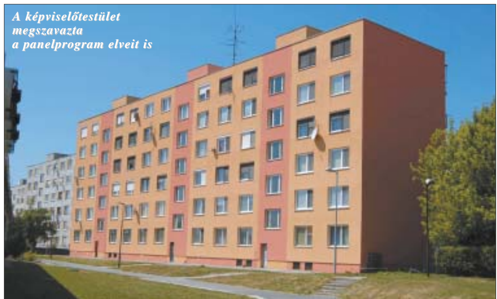
A képviselőtestület megszavazta a panelprogram elveit is

Huszonöt napirendi pont szerepelt az ülés napirendjén, köztük több városi rendelet megvitatása és jóváhagyása is. A napirend elfogadásakor a polgármester indítványára egy pontot levettek a napirendről, egyet pedig beiktattak. Már érvényes rendeletek módosításáról volt részben szó, erre a különböző kedvezményeket nyújtó PRO DS kártya bevezetése kapcsán volt szükség. A képviselőtestület 23 támogató szavazattal, teljesen egyhangúlag hagyta jóvá azokat az elveket, amelyek értelmében a dunaszerdahelyi állandó lakhelyű polgárok májustól igényelhetik, júniustól pedig már használhatják a PRO DS kártyát. A kártyát azok az állandó lakosok válthatják ki, akik tisztességesen fizetik a városi adókat és illetékeket, vagyis nincsen semminemű tartozásuk a várossal szemben. Aki- nek ilyen szempontból "tiszt a lapja", lényeges kedvezményekben részesül, egyebek között a városi létesítményekbe jutányosan válthat belépőjegyet. Ezenkívül az éves parkoló-kártya is szinte a feleannyiba kerül annak, aki birtokosa a PRO DS kártyának. Ezzel a