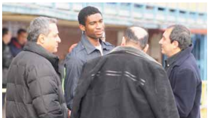
Kweuke volt a csapat gólzsákja: 11 góljával a Corgoň ligában is a második helyen áll. Akkor kaptuk lencsevégre a szomorkodó sztárt, amikor indokolatlan eltiltása miatt két meccsen nem játszhatott....

Radványi az egész őszi teljesítményt is értékelte: „Elégedettek vagyunk, hiszen a bajnokság rajtja előtt kevesen vártak bennünket az 5. helyre. Otthoni mérkőzéseinken a fantasztikus közönségünk minden alkalommal a 12. játékosunk volt. Emellett vannak olyan egyéniségeink, akik otthon képesek meccseket eldönteni. Idegenben, sajnos, egyszer sem tudtunk győzni, de többször is bebizonyítottuk, hogy a csapatnak van tartása. Biztos vagyok abban, hogy egy jó felkészülés után tavasszal idegenben eredményesebbek leszünk.”