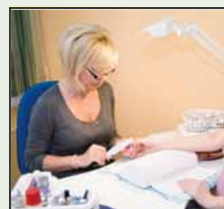
Szépségszalon a Postabank felett Salón krásy nad Poštovou bankou

2009. február 4. * 17. évfolyam * 3. szám * 3. číslo * 17. ročník * 4. februára 2009