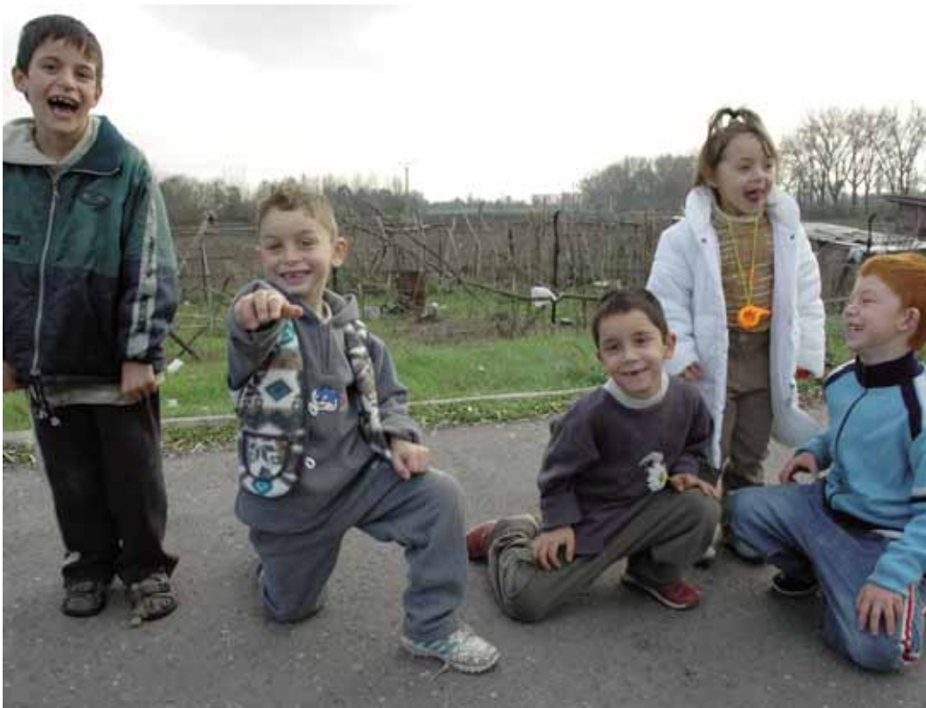
Ani deti sa neocitnú sa na ulici

Skupina odborníkov Výskumného ústavu romológie sa už roky zaoberá problematikou dunakostredských Rómov. V apríli bude piaty rok, čo sú v dennom kontakte s týmito ľuďmi. Spolu so samosprávou pre nich vypracovali projekt, na ktorý získali od ministerstva práce a sociálnych vecí trojročný projekt. Po tom sa opäť úspešne uchádzali o dvojročný projekt.