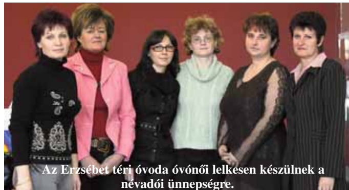
Az Erzsébet téri óvoda óvónői lelkesen készülnek a névadói ünnepségre.

Az óvoda igazgatónője levélben kereste meg Benedek Elek dédunokáját, aki meghatározó levélben köszönte meg azt, hogy a dunaszerdahelyi magyar óvodában ilymódon állítanak emléket a nagy mesemondónak. Borbély Diana szerint az új jogszabályok értelmében az óvodák maguk állítják össze nevelési programjukat. A mi óvodánk programjában nagy hangsúlyt helyezünk arra, hogy a gyerekeket megismertessük a magyar népmesék gyöngyszemeivel, köztük a Benedek Elek csodálatos meséivel, mondta az igazgatónő.