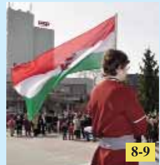
Megemlékeztünk a szabadságharc évfordulójáról / Pripomenuli sme si výročie revolúcie