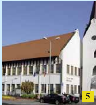
Polgármester-választás: Másfél év a tét / Volby primátora: Ide o poldruha roka