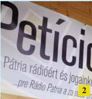
Petíció a Pátria Rádióért / Petícia pre Rádio Pátria

2009. április 8. * 17. évfolyam * 7. szám * 7. číslo * 17. ročník * 8. apríl 2009