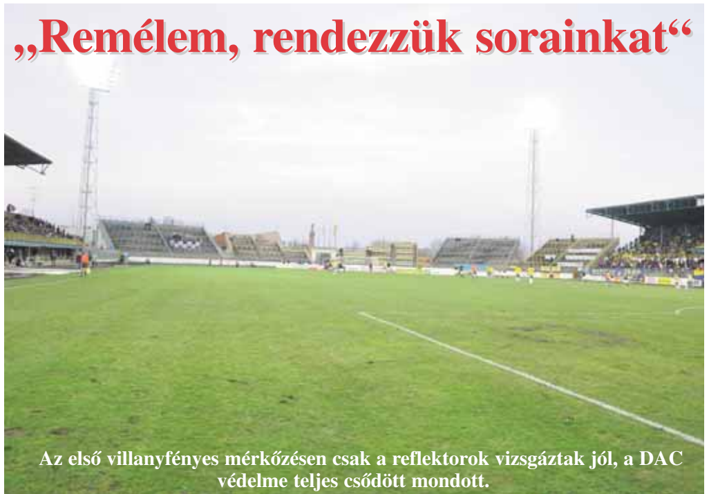
Az első villanyfényes mérkőzésen csak a reflektorok vizsgáztak jól, a DAC védelme teljes csődött mondott.