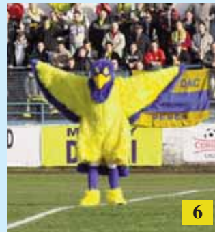
Katasztrofálisan kezdte a szezont a DAC / Mužstvo DAC začal sezónu katasztrofálne