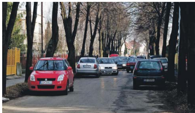
Mnoho áut zaparkujú na blízkej Októbrovej ulici. / A sok parkoló autó od Október utcát is eltorlaszolja.

V súčasnosti sa vypracováva nový územný plán kraja, pričom mesto do tohto plánu navrhne svoje požiadavky, ako napríklad vybudovanie novej cesty medzi Galantskou cestou a Ohradskou cestou za účelom