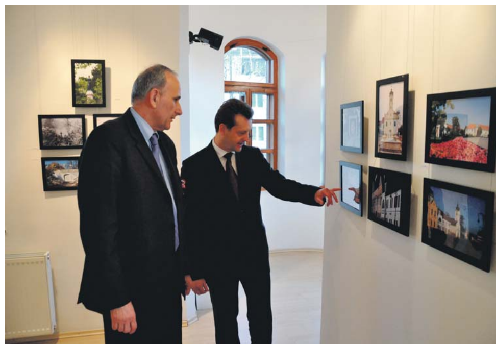
Gémesi György Hájos Zoltán polgármesterrel a fénykéпкиállításán.

A találkozót követően került sor a Kortárs Magyar Galériában a „Gödöllő Európában - Gödöllő múltja és jelene” című fotókiállítás megnyitására, melyet korábban Gödöllő két testvértelepülésén, a kárpátaljai Beregszászon, majd a vajdasági Zentán mutattak be a nagyközönségnek.