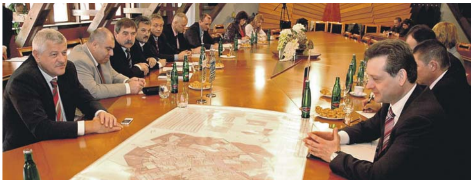
Napirenden szerepelt a városfejlesztési terv és a megyei terv egyeztetése.

Városunk polgármestere számos orvoslást igénylő problémát vetett fel Nagyszombat megyei vezetőinek