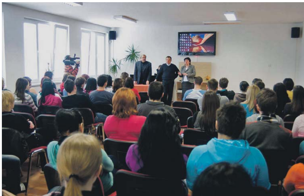
Ha legalább 15-en jelentkeznek, akkor az idén beindul Dunaszerdahelyen a székesfehérvári Kodolányi János Főiskola kihelyezett képzése.