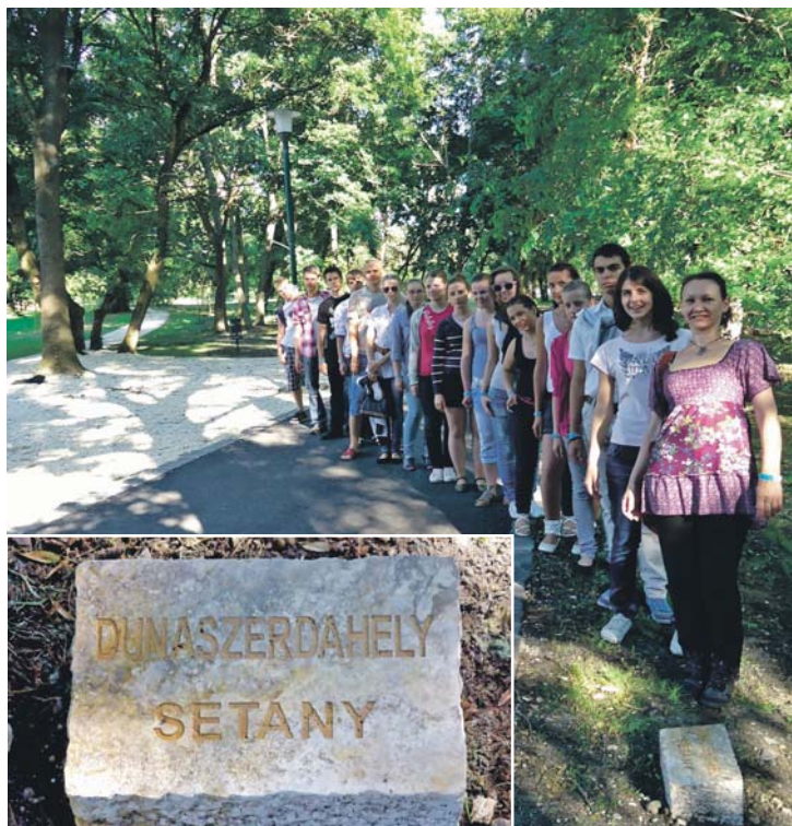
A Dunaszerdahelyi sétány és a Dunaág táncsoport Gödöllőn.

A központban és a Városházán fotókiállítás nyílt, amely a testvértelépülések nevezetességeit mutatta be a közönségnek. A főtéren éjfélig tartottak a programok. Felavatták a testvérvárosok oszlopát, amelyen tábla mutatja valamennyi település irányát és Gödöllőtől való távolságát.