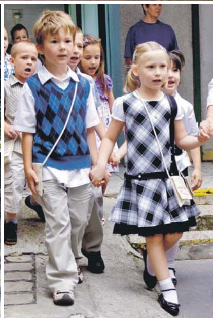
Ballagás az óvodában.