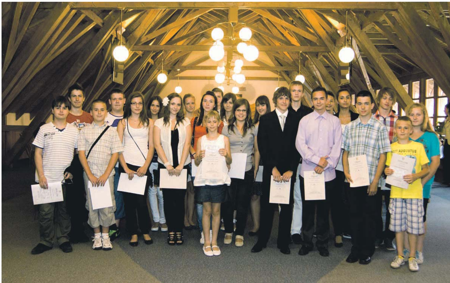
Ocenení žiaci mestských základných škôl na radnici.