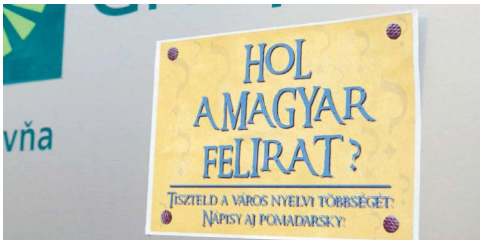
Városszerte a napokban számos helyen jelentek meg plakátok azokon a helyeken, ahol csak államnyelven vannak feliratok.