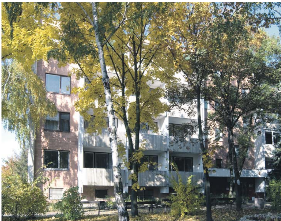
V zariadení pre seniorov na sídlisku Západ pribudne nadstavba.