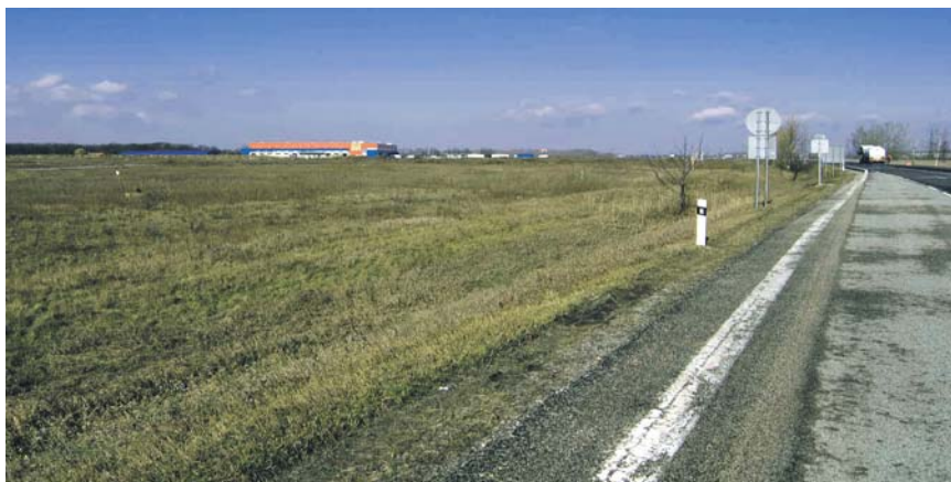
Az osztrák cég akkumulátorgyára közvetlenül Dunaszerdahely mellett épülne meg. Závod na výrobu akumulátorov by sa mal stavať bezprostredne pri Dunajskej Stredě.

Dunaszerdahely városa kész bírósághoz fordulni ivóvízkincsünk megóvása érdekében